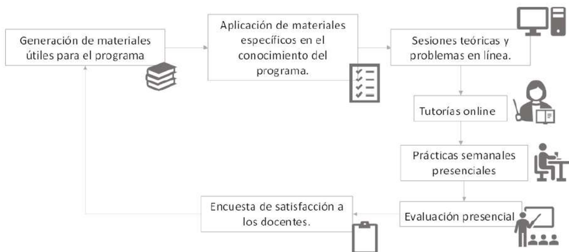
Figura. 1. Fases de la investigación.

La muestra estuvo conformada por 25 docentes de la Unidad Educativa “Eduardo Granja Garcés”, a los que se aplicó una encuesta para conocer el uso de las herramientas digitales en el aula y la incorporación del software GeoGebra en la enseñanza matemática. Para ello la metodología de este estudio comprendió la capacitación docente para la implementación de la herramienta digital en la enseñanza de las ecuaciones cuadráticas, de manera que el docente tuviera la formación necesaria y suficiente para adaptar su contenido de clases al software GeoGebra y de esta manera poder experimentar con los estudiantes. Una vez concluida la capacitación, y llevado a cabo el experimento en el aula, fue necesario conocer si fue efectivo el aprendizaje y si los estudiantes lograron una motivación adicional a las clases de matemáticas. Para ello se realizó una encuesta de preguntas cerradas, que permitió al docente exponer sus vivencias y con ello evaluar las mejoras de la estrategia y las perspectivas futuras.