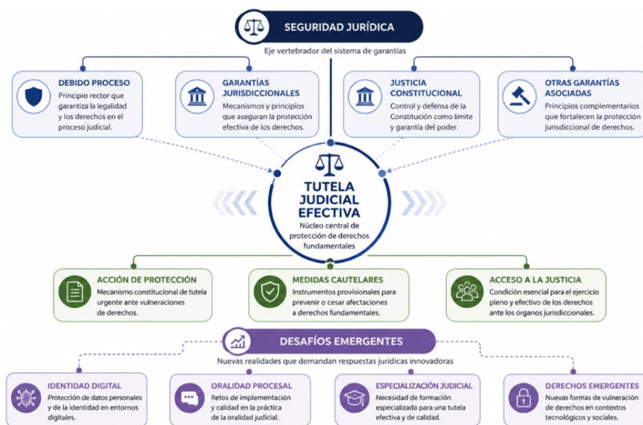
Fig. 3. Mapa de coocurrencia de términos jurídicos predominantes.

En el núcleo temático se ubica la tutela judicial efectiva, entendida como el principal mecanismo de garantía para la protección de los derechos reconocidos por el ordenamiento jurídico ecuatoriano. Alrededor de esta categoría convergen las investigaciones relacionadas con la acción de protección, las medidas cautelares y el acceso a la justicia, tópicos que concentran la mayor parte de los estudios identificados en el corpus documental.